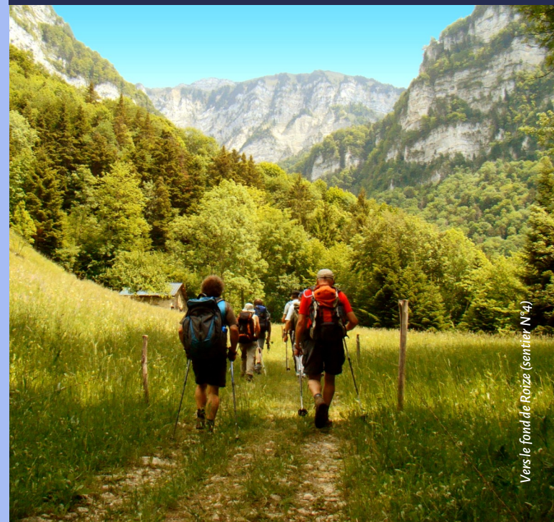
Vers le fond de Roize (sentier N°4)