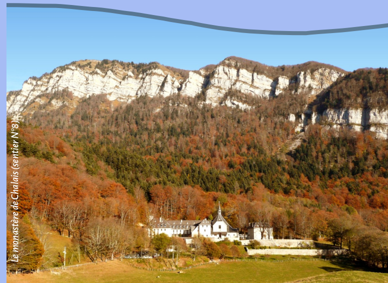
Le monastère de Chalais (sentier N°8)