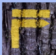
Tourner vers la droite