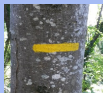
Continuer sur ce sentier